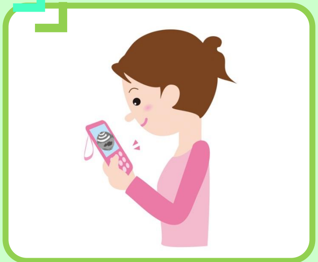
スマートフォン・パソコンより エコー動画を閲覧できます